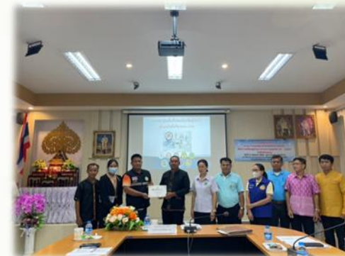
พื้นที่ปลอดโรคพิษสุนัขบ้าระดับท้องถิ่น อำเภอโพธิ์ศรีสุวรรณ