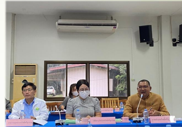
พื้นที่ปลอดโรคพิษสุนัขบ้าระดับอำเภอ อำเภอโพธิ์ศรีสุวรรณ