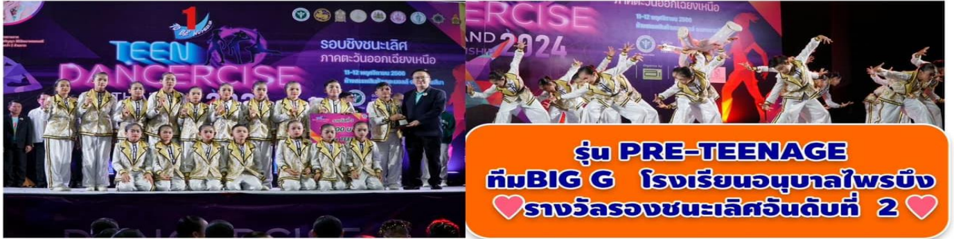
รุ่น PRE-TEENAGE ทีมBIG G โรงเรียนอนุบาลไพรบึง ♡รางวัลรองชนะเลิศอันดับที่ 2♡