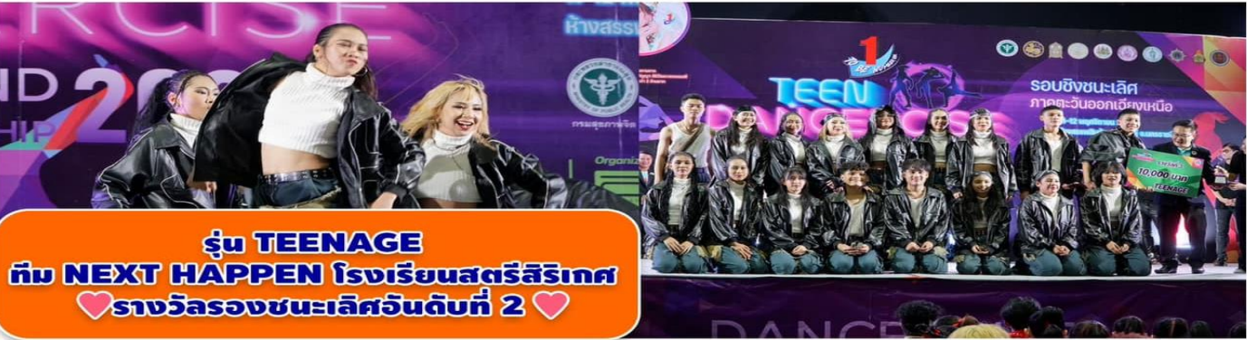
รุ่น TEENAGE ทีม NEXT HAPPEN โรงเรียนสตรีสิริเกศ ♡รางวัลรองชนะเลิศอันดับที่ 2♡