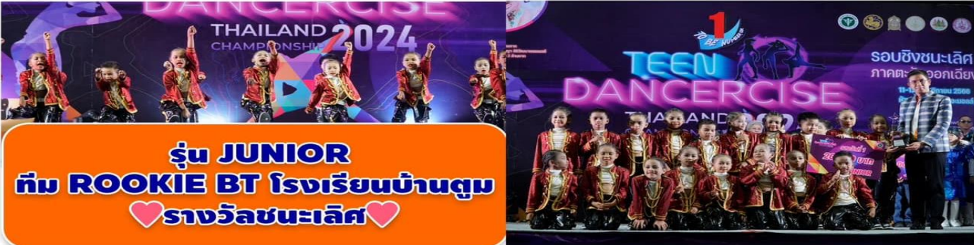
รุ่น JUNIOR ทีม ROOKIE BT โรงเรียนบ้านตุม ♡รางวัลชนะเลิศ♡

๒.๑ การเข้าร่วมประกวด TO BE NUMBER ONE TEEN DANCERCISE 2024 ระดับประเทศ ๓-๔ ก.พ. ๖๗ ณ.เดอะมอลล์ บางกะปิ กรุงเทพฯ ฯ (อ.เมืองฯ/ศรีรัตนะ/ไพรบึง)