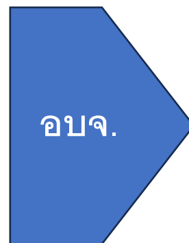
สรุปความก้าวหน้าการลงทะเบียน Health ID ตั้งแต่ 1 กค.67