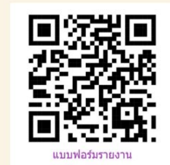
ดาวโหลดแบบฟอร์ม รายงานเคสต้องสงสัย