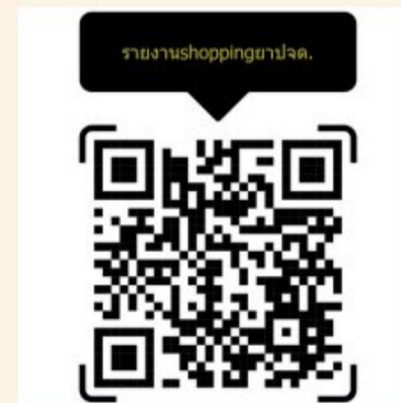
รายงานประจำเดือน